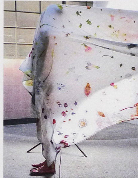
Bettbezug «Embedded Stories» (ab 199 Fr.), von Estelle Gassmann.